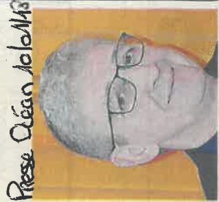
Presse Océan 26/02/18

septembre au plus tard. « Le permis de construire sera déposé cet été. L'architecte Nicole Cantin prépare le dossier d'appel d'offres ». Les élus ont également choisi d'implanter deux caméras de surveillance sur le site.