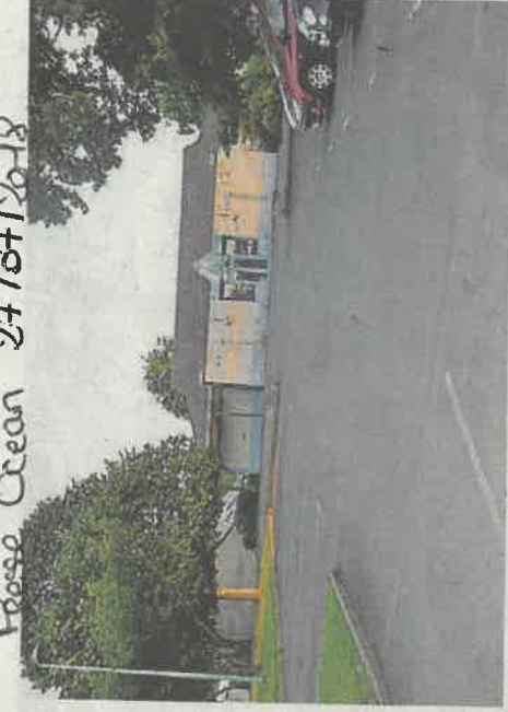
Presse Océan 24/07/2018

Les élus ont choisi une structure galvanisée.