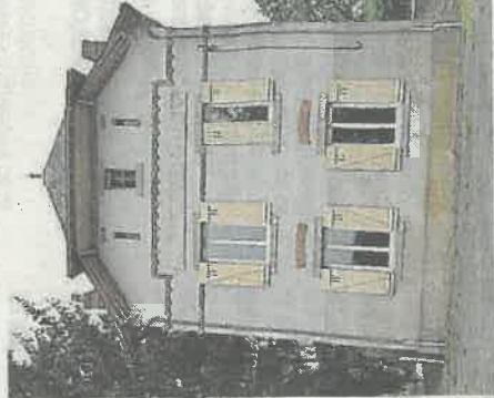
Placement dit « Nord » de la Grotte

La municipalité a mis en vente, le mois dernier, le logement de la Grotte, situé sur la route de Guéméné-Pentao. Celui-ci a très rapidement trouvé acquéreur, pour un montant de 58 400 €, et sera vendu avec un terrain attenant d'une surface de 778 m 2 . Les toilettes, qui sont accolées au logement, resteront propriété de la commune. Le maire signera le compromis de vente avant le 13 juillet.