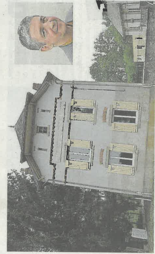
MASSÉRAC. Au conseil municipal P.O. 20/04/2017. Les impôts locaux stables

Il y a un an, la municipalité mettait en place le tri sélectif des déchets sur la commune (sacs jaunes). Une première année très positive puisque : « La formule des sacs jaunes permet de récupérer 5 kg de déchets supplémentaires par habitant, ce qui n'est pas négligeable, explique le maire, Fabrice Sanchez, et nous sommes à 17 kg récupérés pour l'année par habitant ». Il est possible