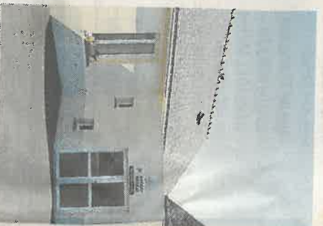
Le nom du cabinet médical sera choisis les 23 mars.

Concernant l'accessibilité aux établissements recevant du public, des travaux seront